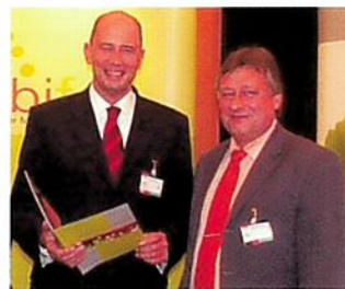
Bundestagabgeordneter Martin Burkert (rechts) mit Verkehrsminister Tiefensee am mobifair-Stand.

wegfallen. Die Vergabe-Beispiele zeigten, dass Mindestlöhne ein wirksames Mittel gegen Dumpinglöhne wären. So könnte ein Branchenmin-