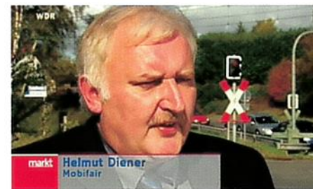
Der Geschäftsführer von mobifair in der Sendung "markt" des WDR.

Gleis niemals genommen werden können. Bei den Re- cherchen in NRW musste mobifair mit Entsetzen feststellen, dass ein „DIXI- Klo“ als Sozialraum und einzi-