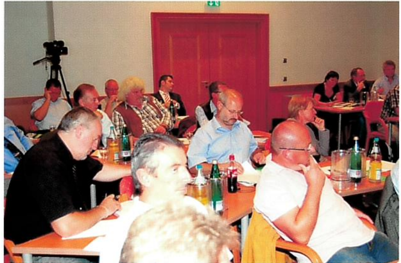
Interessiert und diskussionsfreudig zeigten sich die Teilnehmer.